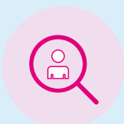
Řízení lidských zdrojů