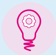
Realizace a řízení projektů